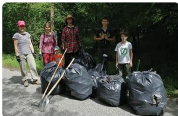
Na brigáde sa zúčastnilo niekoľko rodín s deťmi. Plastové vrecia zaplňali všetci spoločne.