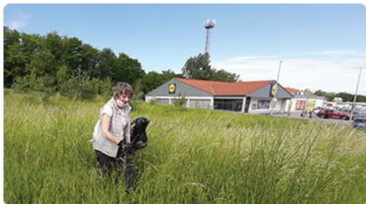
Lúka pri Lidli je známa tým, že je na nej neustále čo upratať. Naše aktívne seniorky sa však energicky pustili do jej čistenia.