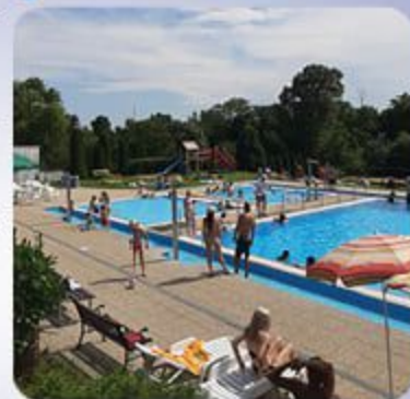
Lamačské kúpalisko otvorilo svoje brány v polovici júna.

V súvislosti s pandemiou koronavírusu a s hygienickými opatreniami, vás na kúpalisku čaká zopár obmedzení. Ide napríklad o meranie teploty pri vstupe. Ak budete mať viac ako 37,2 °C, do vnútra sa nedostanete. Medzi ležadlami či dekami musí byť minimálne dvojmetrový rozstup. Rúška na tvári povinné nie sú. Všetky kúpaliská musia tiež podľa informácií, ktoré priniesli Bratislavské noviny zabezpečiť nefunkčnosť pitných fontánok a bazény nesmú mať funkčné atrakcie, pri ktorých dochádza k tvorbe aerosólov.