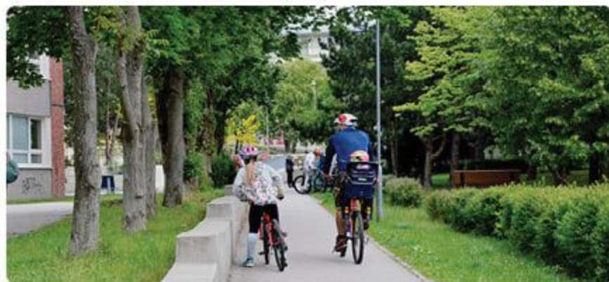
Lamačania sa bicyklujú po chodníkoch, nové cyklotrasy im preto padnú vhod.