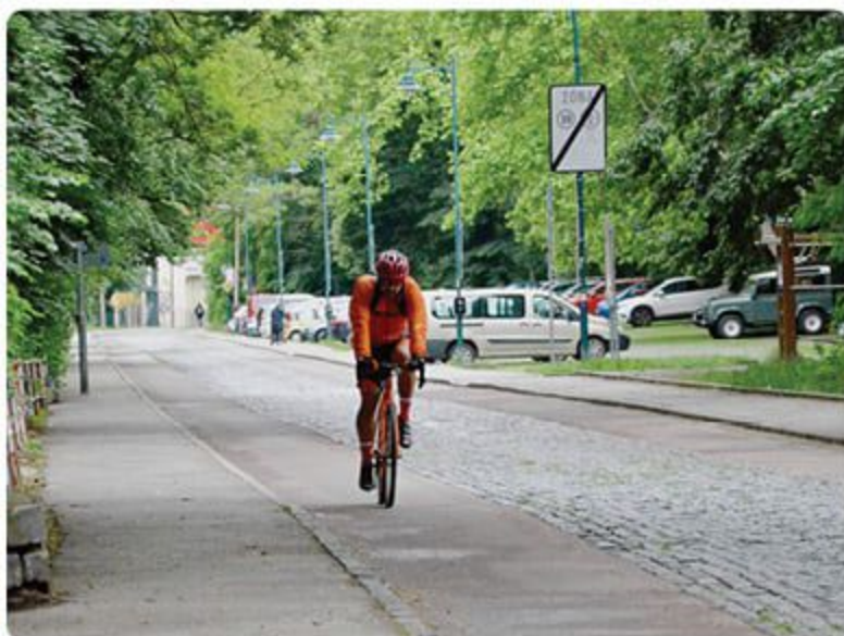
Bicykel je čoraz obľúbenejším prepravným prostriedkom.