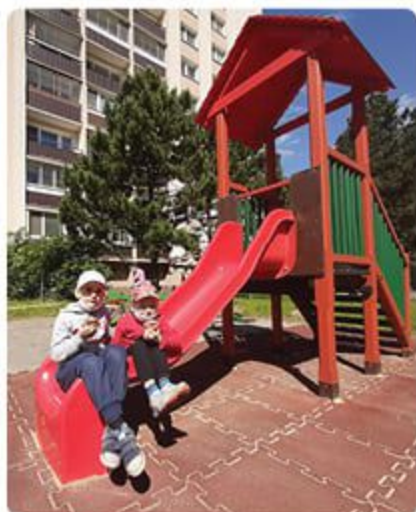
Novým farbám sa tešila najmä deti.