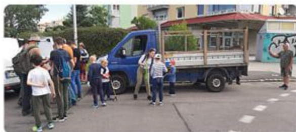
Stretávka bola ráno pred Pantlom. Účastníci dostali rukavice, vrecia, náradie a v skupinkách sa rozprchli na vopred určené miesta.