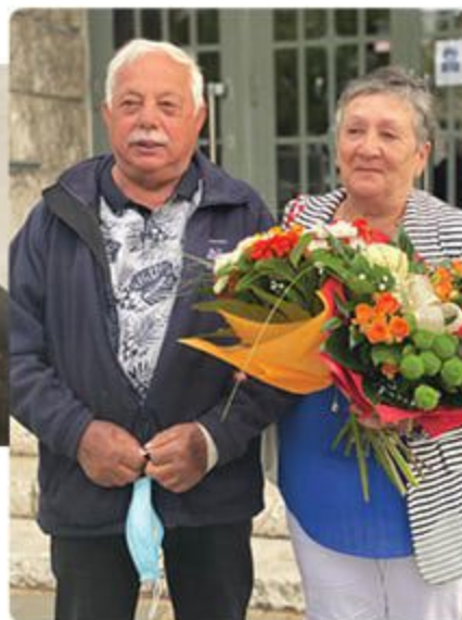
Haraslínovci vtedy a dnes.

„Ani sama neviem, ako to ubehlo. Prežili sme dobré časy, ale aj zlé časy, obaja sme si prešli chorobami. Starali sme sa o deti, záhrady, stavali sme dom. Mali sme starosti a nemali sme čas sa hádať – to nás držalo. Na dlhé manželstvo potrebujete veľa trpezlivosti, čo sa už dnes nenosí.