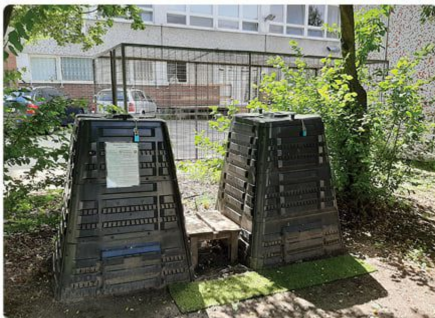
Komunitné kompostery nájdete v našej mestskej časti už na troch miestach.