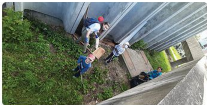
Okolie bývalého Obchodného domu Lamač dobrovoľníci prečesávali doslova detailne.