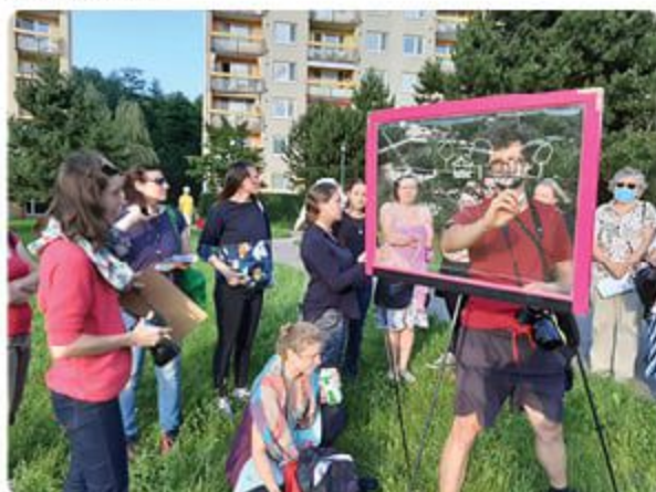
Tento červený rám slúžil ako akési okno do budúcnosti, na ktoré Lamačania zakresľovali svoje predstavy.