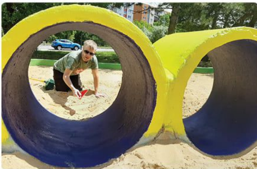
Lamačské ihriská prechádzajú rozsiahlou rekonštrukciou.

O bdobie, počas ktorého sa neodporúča vstup na detské ihriská, sa využilo na ich významnú revitalizáciu. Pracovníci komunálnych služieb ich vyčistili od nečistôt a burín, na múriky nahodili novú omietku, opravovali hracie prvky a dopadové plochy v zmysle výstupov revíznej komisie. Na pláne je aj veľké maľovanie.