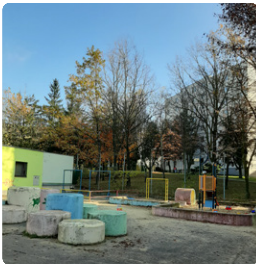
Ihrisko na Malokarpatskom námestí prejde výraznou rekonštrukciou.

Z časti pôjde o atypické riešenie, kde sa pre detský tunel v umelom kopci využijú súčasné betónové valce. Pomocnú ruku