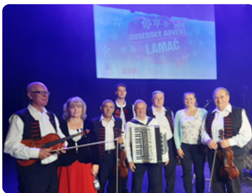
Čaká na vás aj Ľudová hudba Nebantuj.