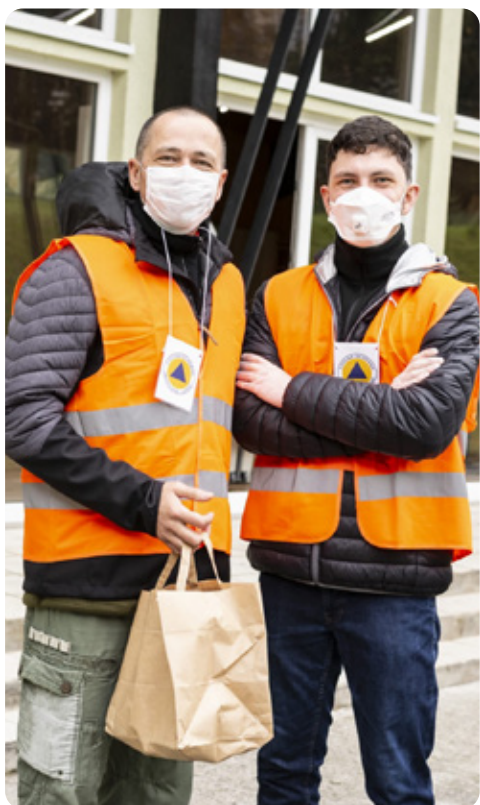
Dobrovoľníci v Športovej hale Lamač Na barine vám prijímali čakanie vtipkovaním.