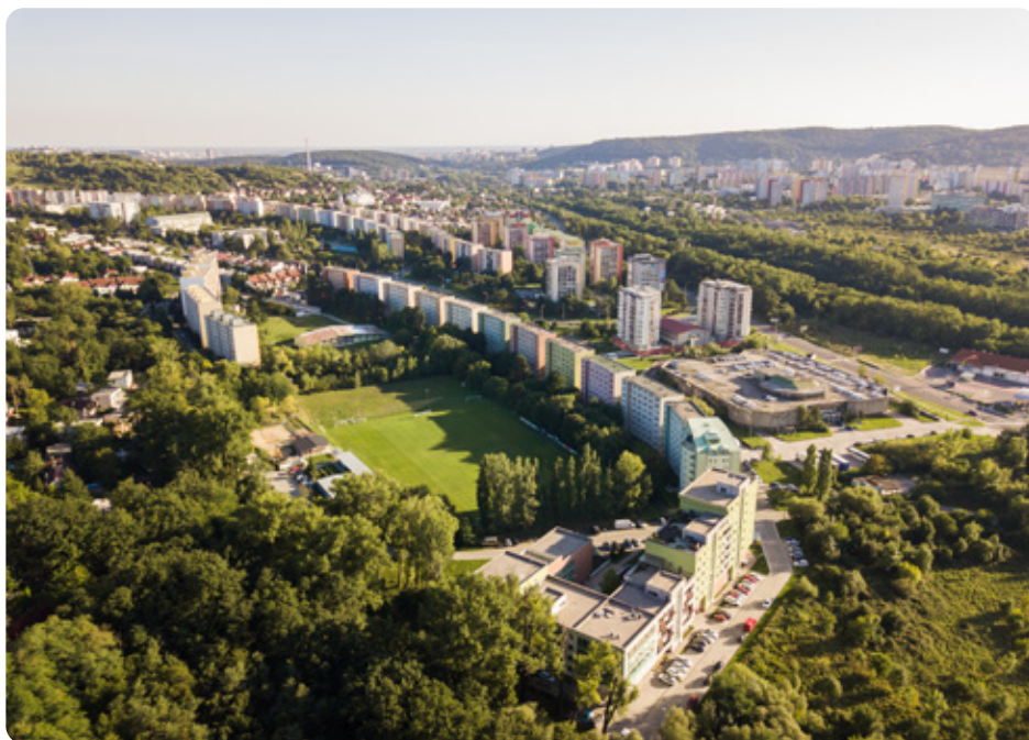
Lamač čaká sčítanie obyvateľov.