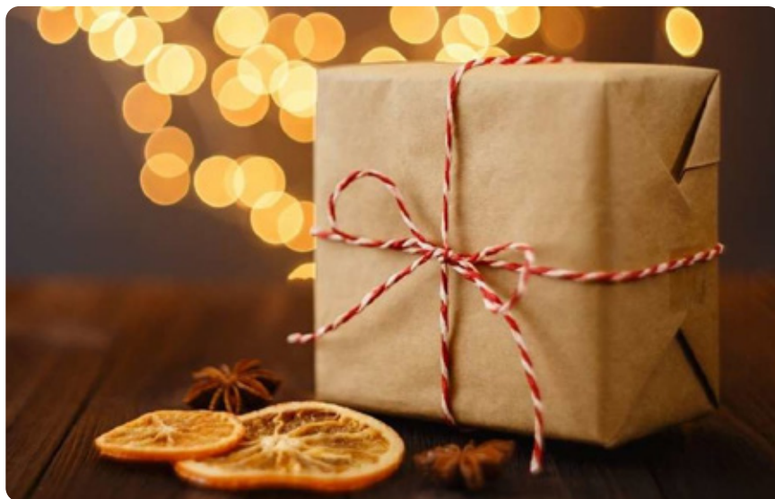
Fototext: Na balenie darčiekov môžete využiť hocijaký papier.