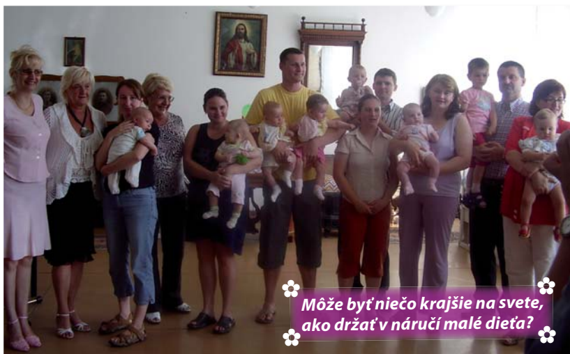
Môže byť niečo krajšie na svete, ako držať v náručí malé dieťa?

Pri občerstvení si všetci navzájom porozprávali zážitky a skúsenosti s výchovou svojej ratolešti. Keď porozprávajú ostatným mladým mamičkám a oteckom, ako im u nás bolo, veríme, že na najbližšej akcii bude malých Lamačanov viac. BV