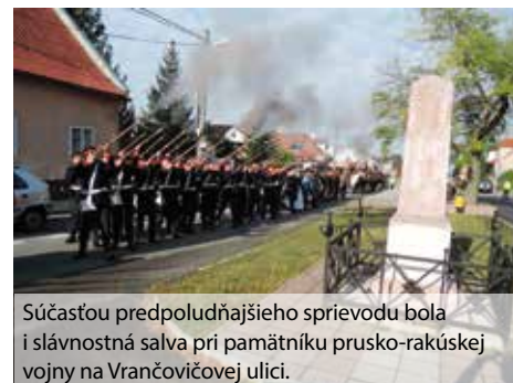
Súčasťou predpoludňajšieho sprievodu bola i slávnostná salva pri pamätníku prusko-rakúskej vojny na Vrančovičovej ulici.