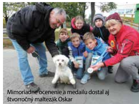
Mimoriadne ocenenie a medailu dostal aj štvorročný maltezák Oskar