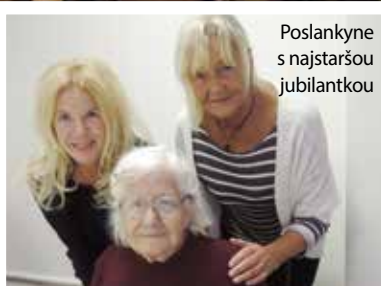
Poslankyne s najstaršou jubilantkou