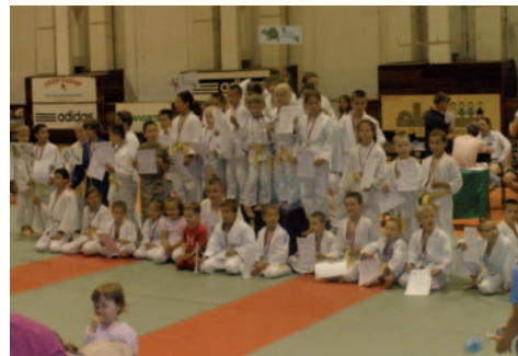
Turnaj Mini Slávia STU Cup 27. 6. 2010

Džudo v Lamači je už štvrtý rok, za to obdobie sa podarilo vybudovať silnú a kvalitnú zá-