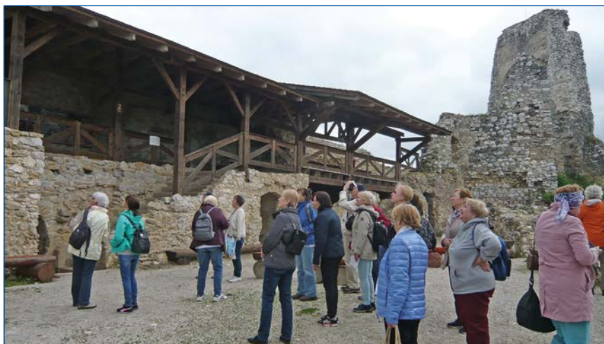
V areáli Čachtického hradu