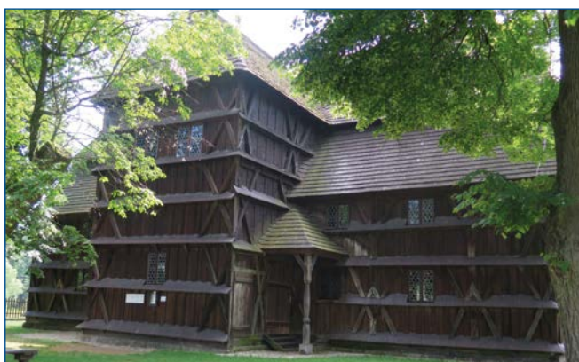
Tradičný kostolík v Hronseku