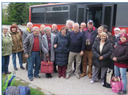
Pri autobuse do Veľkého Medera