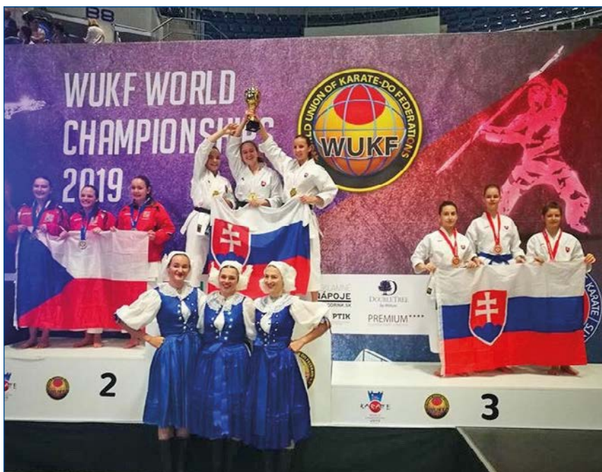
Naše dievčatá na zlatých a bronzových miestach