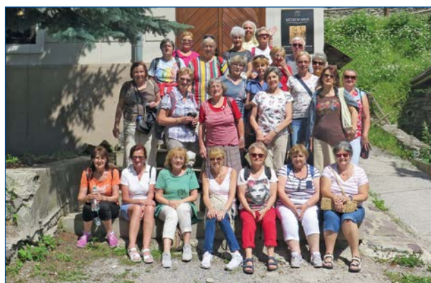
Návšteva múzea v Španej Doline