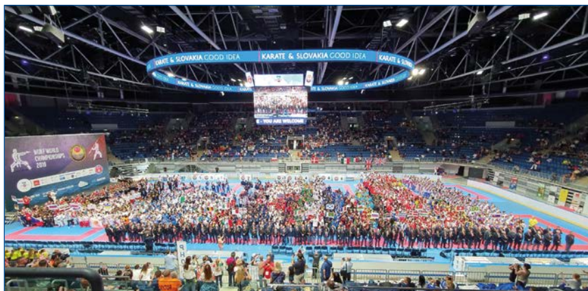
Otvárací ceremoniál majstrovstiev sveta v karate 2019 na štadióne Ondreja Nepelu v Bratislave