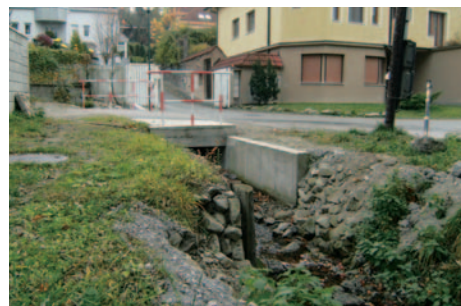
Horný priepust - nový stav.

teraz sa dokončuje realizácia druhého priepustu v zmysle projektovej dokumentácie.