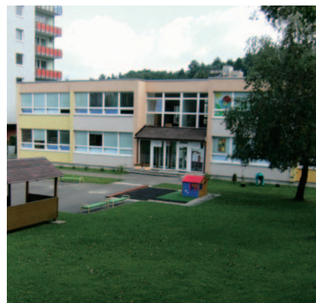
Nový areál materskej školy v priestoroch Oázy.

5. Zabezpečiť prevádzku a modernizáciu základnej školy a materskej školy - nový areál MŠ v priestoroch Oázy je v prevádzke od septembra 2008. V lete 2009 sa uskutočnila úprava vnútorných priestorov MŠ na Heyrovského ulici č. 4, toto leto bola budova MŠ kompletne zateplená a pribudla jej aj nová strecha.