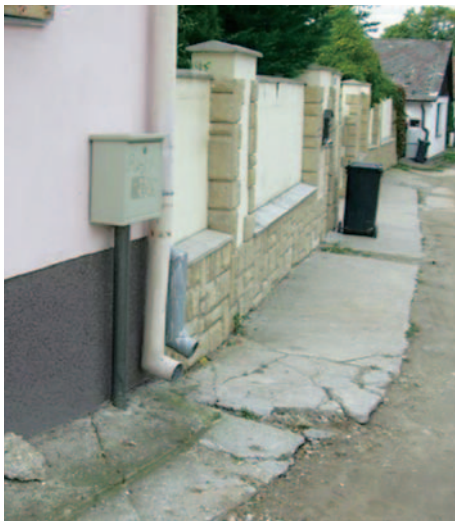
Zhorínska ulica bola dlhoročne neudržiavaná...

9. Zabezpečiť rekonštrukciu komunikácie na Zhorinskej ulici - rekonštrukcia komunikácie na Zhorinskej ulici bola ukončená v septembri 2009.