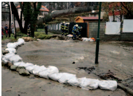
Vyliaty Lamačský potok.