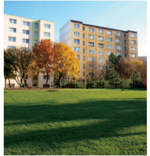
Parčík za Studenohorskou ulicou č. 1-7.

10. Dobudovať obecnú studňu a vytvoriť systém zavlažovania parkovej zelene – trávniky, stromy a kvetinové záhony - systém zavlažovania je vybudovaný v areáli Základnej školy na Malokarpatskom námestí.