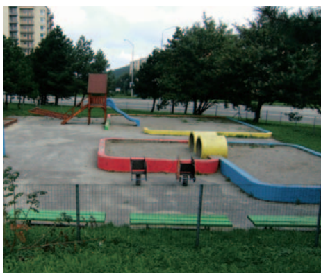
Zrekonštruované ihrisko na Heyrovského ulici.

2. Rekonštrukcia vnútorných priestorov kina Lamač - rekonštrukcia sa týkala schodišťa, chodby na prvom poschodí, veľkej a malej zasadačky, vybudovania nových sociálnych zariadení na prízemí kina a dodatočne aj rozšírenia javiska. Kino bolo zrekonštruované k aprílu 2009.