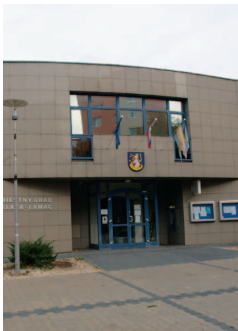
Budova Miestneho úradu na Malokarpatskom námestí.

11. Zabezpečiť zriadenie klientskeho centra na poskytnutie služieb prvého kontaktu občana s úradom - klientske centrum je zriadené v novej budove MÚ na Malokarpatskom nám. od mája 2009.