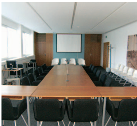
Zrekonštruovaná zasadačka v budove kina.

2. Rekonštrukcia vnútorných priestorov kina Lamač - rekonštrukcia sa týkala schodišťa, chodby na prvom poschodí, veľkej a malej zasadačky, vybudovania nových sociálnych zariadení na prízemí kina a dodatočne aj rozšírenia javiska. Kino bolo zrekonštruované k aprílu 2009.