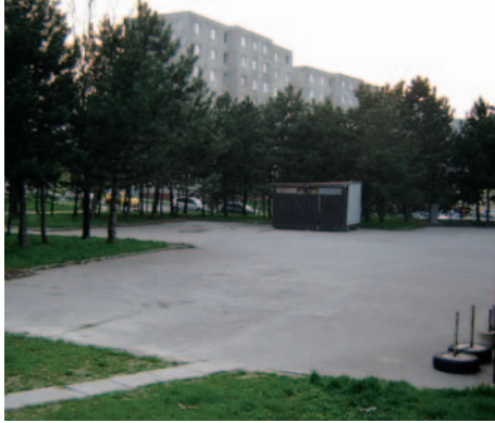
Takto vyzeralo trhovisko pred rokom 2008...

8. Úprava trhoviska na Malokarpatskom námestí - úloha je zrealizovaná, kolaudácia sa uskutočnila v júni 2009, postupne sa zmenili chodníky od Malokarpatského námestia popri ihriskách až po Studenohorskú ulicu č. 2 na zámkovú dlažbu a boli osadené nové lavičky, odpadkové koše a nové osvetlenie. Súčasťou trhoviska sú aj nové stánky predaja.