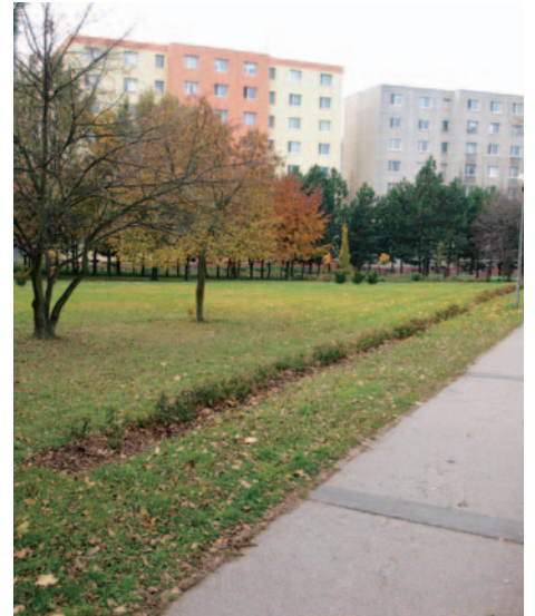
Parčík medzi Studenohorskou ulicou a ZŠ.