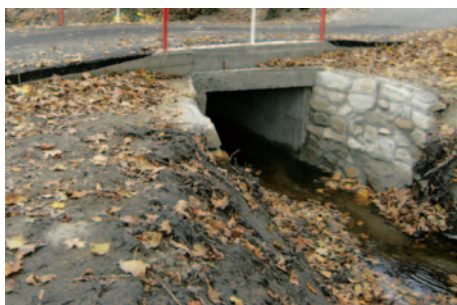
Dolný priepust - nový stav.

teraz sa dokončuje realizácia druhého priepustu v zmysle projektovej dokumentácie.