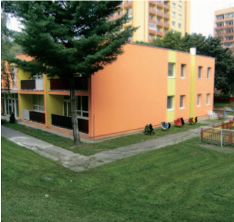
Zrekonštruovaná budova MŠ na Heyrovského ulici.

6. Zabezpečiť rekonštrukciu a premiestnenie pamätníka Bitky pri Lamači (Popova húšť) na Vrančovičovú ulicu - rekonštrukcia a premiestnenie pamätníka Bitky pri Lamači (Popova húšť) na Vrančovičovú ulicu sa uskutočnila koncom roka 2008.