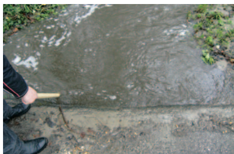
Dolný priepust vyliaty - pôvodný stav.

4. Zabezpečiť reguláciu koryta a rekonštrukciu objektov na Lamačskom potoku - SVP realizoval výstavbu prvého priepustu,