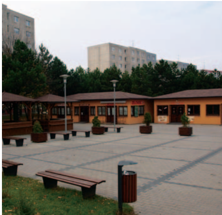
... a takto vyzerá dnes.

9. Zabezpečiť rekonštrukciu komunikácie na Zhorinskej ulici - rekonštrukcia komunikácie na Zhorinskej ulici bola ukončená v septembri 2009.