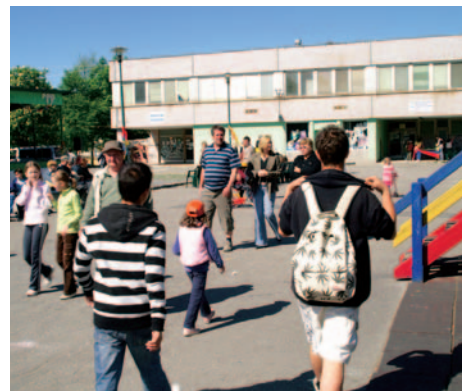
Budova Zdravotného strediska pred rekonštrukciou...

4. Zabezpečiť prevádzku a modernizáciu zdravotného strediska - budova bola zateplená, vymenili sa staré okná za plastové, rekonštrukcia sa uskutočnila v roku 2008.