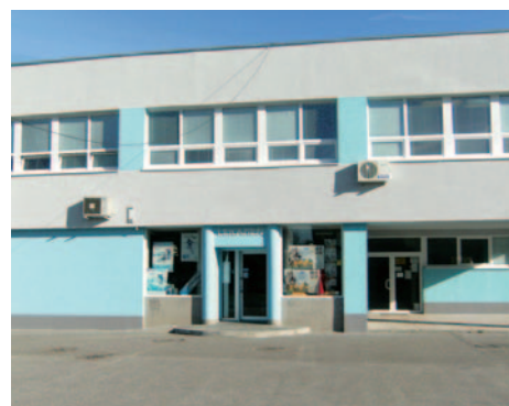
... a po rekonštrukcii.

5. Zabezpečiť prevádzku a modernizáciu základnej školy a materskej školy - nový areál MŠ v priestoroch Oázy je v prevádzke od septembra 2008. V lete 2009 sa uskutočnila úprava vnútorných priestorov MŠ na Heyrovského ulici č. 4, toto leto bola budova MŠ kompletne zateplená a pribudla jej aj nová strecha.