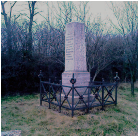
Pamätník „Bitky pri Lamači“ v pôvodnom prostredí.

6. Zabezpečiť rekonštrukciu a premiestnenie pamätníka Bitky pri Lamači (Popova húšť) na Vrančovičovú ulicu - rekonštrukcia a premiestnenie pamätníka Bitky pri Lamači (Popova húšť) na Vrančovičovú ulicu sa uskutočnila koncom roka 2008.