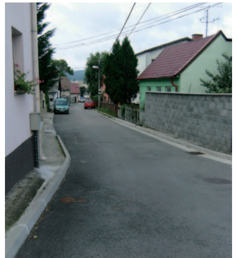
... a takto vyzerá dnes.