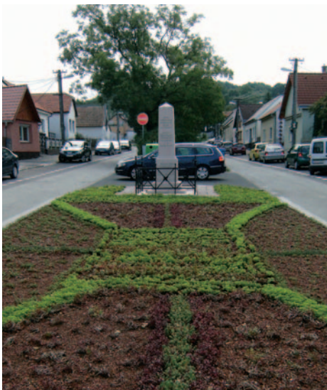
Rekonštrukcia Vrančovičovej ulice s premiestneným pamätníkom „Bitky pri Lamači“.

7. Zabezpečiť aktualizáciu ÚPD zóny Staré záhrady - aktualizácia ÚPD zóny Staré záhrady je zabezpečená.