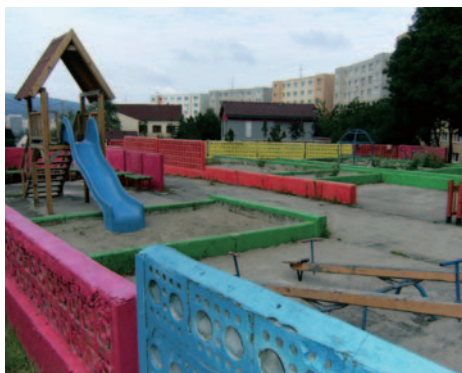
Ihrisko na Studenohorskej ulici pred a po rekonštrukcii.