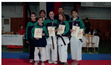
Úspešní juniorskí reprezentanti.