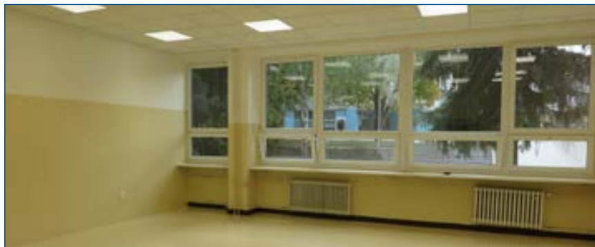
Bývalá šatňa pripravená na triedu.