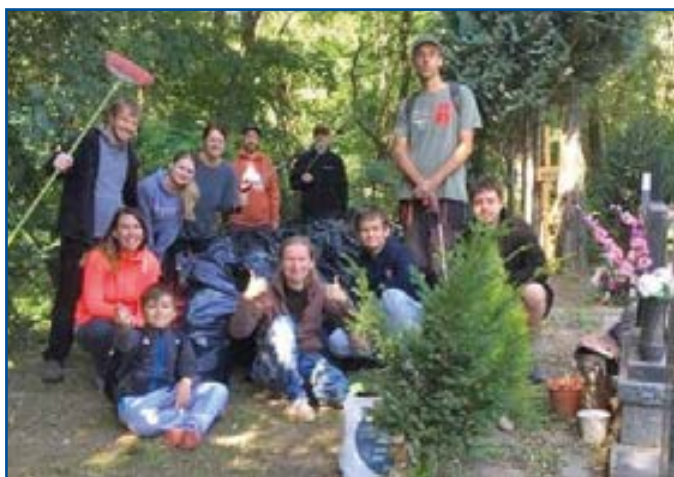
Dobrovoľníci počas upratovania Lamača.