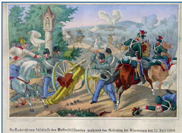
Die Nachricht vom Abbruch des Waffenstillstandes während des Gefechtes bei Blumenthal den 22. Juli 1866

Prehraná bitka pri Hradci Králové znamenala zničenie morálnej sily rakúskej severnej armády a rozhodla o osude celej vojny. Celkové straty Rakúšanov pri