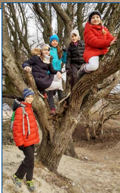
Pajštún je z Lamača naskok.

ľudí – niektorí opekali, niektorí sa iba kochali výhľadmi a ďalší sa snažili zistiť niečo z histórie hradu. Hore veľmi fúkalo, takže sme sa veľa nezdržovali. Aj my sme sa pokochali