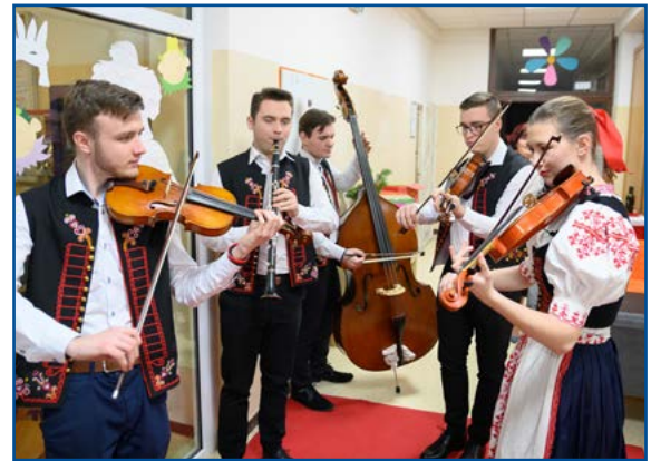
Ludová hudba folklórneho súboru Gymnik

Veľká vďaka patrí zamestnankyniam miestneho úradu, ktoré celú akciu zastrešili a premenili bežnú školskú jedáleň na vyzdo-