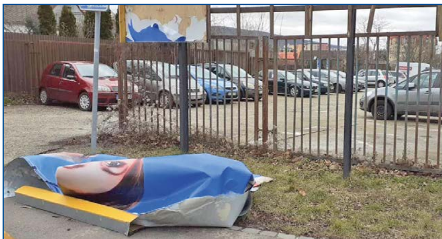
Poškodený bilbord pri bývalom zbernom dvore.