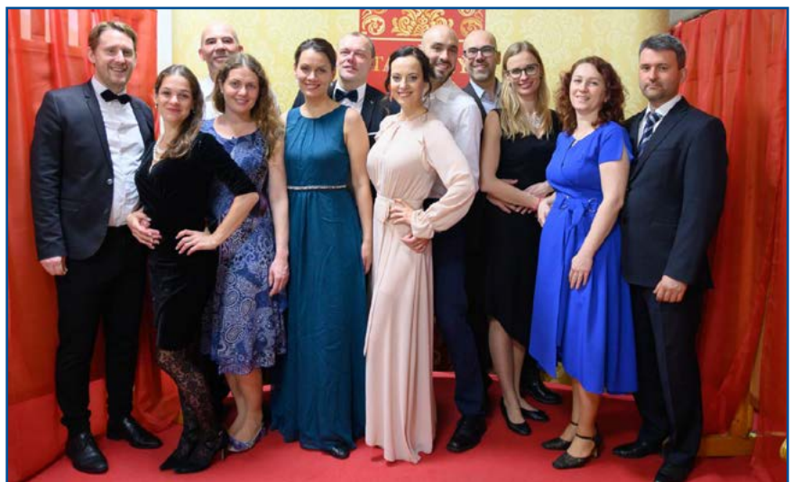
Lamačania si mohli dať urobiť spomienkové zábery pred fotosenou

benú tanečnú sálu. Tanečný parket, svetlá, priestor pre hudobné skupiny... To