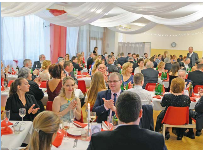
Príjemnú atmosféru večera si užívalo takmer 150 hostí