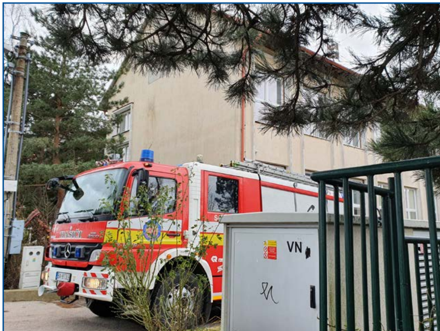
Vietor sa opäť oprel aj do strechy školy na Borinskej ulici.

Lamačania hlásili výpadky elektrickej energie na Studenohorskej ulici, na ulici Podháj či na Ceste na Klanec. Podľa hovorkyne Západoslovenskej energetiky Michaely Dobošovej bola najhoršia situácia 4. a 5. februára, keď spoločnosť vyhlásila mimoriadny stav pre oblasti Bratislava, Trnava, Trenčín, Nové Zámky, Senica, neskôr bol rozšírený na celé distribučné územie. „Celkovo bolo počas týchto dní evidovaných takmer 170-tisíc odberných miest, v ktorých došlo k výpadku elektrickej energie. Výpadky boli spôsobené hlavne popadanými stromami na vedeniach a potrhanými vodičmi. Niektoré opravy si vyžiadali dlhší čas, pretože bolo potrebné odstrániť pováľané stromy v ťažko dostupnom teréne. V čase kalamitnej situácie evidujeme v Lamači jednu poruchu v trvaní nad 2 hodiny. Išlo o výpadok hlavného ističa na trafostanici, postihnutých bolo 307 odberných miest. V tomto čase bol v doméne Bratislava vyhlásený mimoriadny stav, k oprave tejto poruchy sa pristúpilo hneď, ako to bolo kapacitne možné,“ povedala pre náš mesačník M. Dobošová. Obyvatelia Lamača však zaznamenali až vyše 12-hodinový výpadok elektrickej energie.