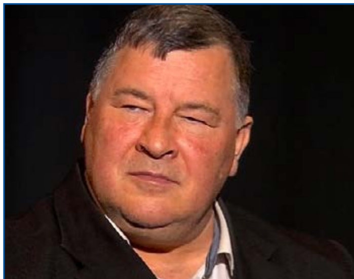
Profesor Vladimír Krčméry

Kam máme zavolať pri podozrení na koronavírus?