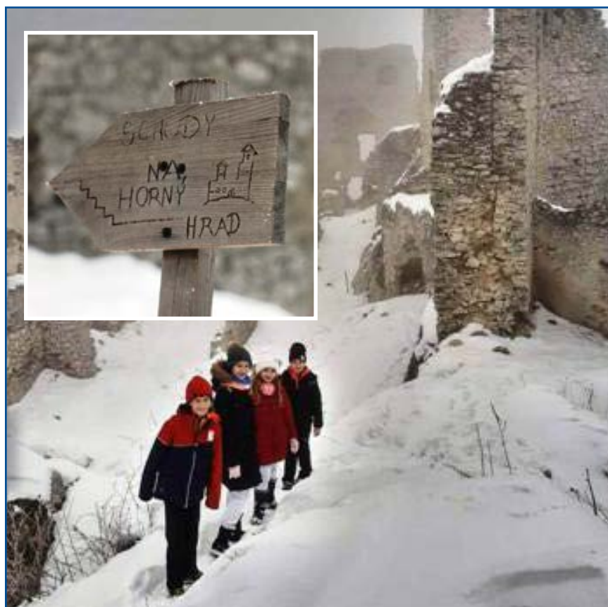
Autorka mala šťastie na jeden z mála zasnežených dní v tomto roku.

Prešli sme veľkolepou vstupnou bránou a za ňou sme rôznymi chodníčkami pomedzi zvyšky múrov začali objavovať rozmanité zákutia tohto hradu. Schody na horný hrad sme kvôli obavy z pošmyknutia obišli. Ďalšou bránou sme však prešli na nádvorie, na ktorom sme si rozložili tábor. Tí odvážnejší pokračovali v objavo-