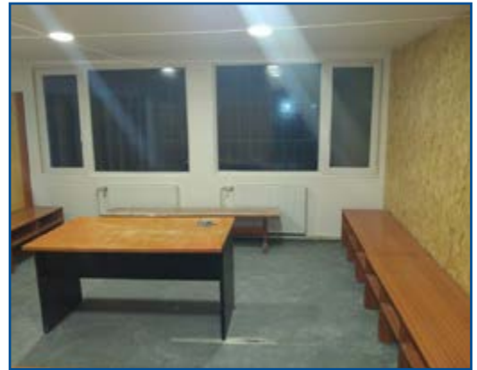
Zrekonštruované šatne vyzerajú parádne.

„Chcel by som odkázať fanúšikom, aby držali s nami, aby všetkých Lamačanov táto choroba obišla milfóvymi krokmi a aby sme sa čo najskôr mohli stretnúť v našom areáli a spoločne povzbudzovať futbalistov, od tých najmenších až po najstarších,“ dodáva Polák.