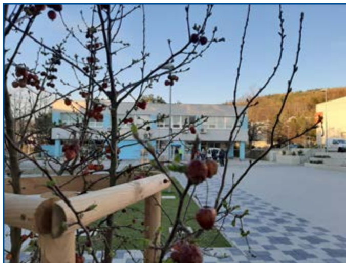
Rekonštrukcia zdravotného strediska trvala približne šesť týždňov.