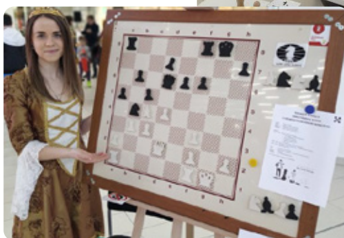
Počas celého dňa bol pre návštevníkov pripravený aj jednoduchý šachový kvíz, ktorý pozostával z ôsmich otázok.

chových olympiád a vyhral prestížne medzinárodné turnaje, je určite zážitok. Jedenásti odvážlivci tak zasadli k šachovniciam a snažili sa pretlačiť veľmajstra. Ten mal úlohu sťaženú aj tým, že na všetky partie mal dovedna iba 30 minút. Dvom sa však predsa len podarilo ukoristiť vzácne remízy a po skončení nechýbala ani malá autogramiáda.