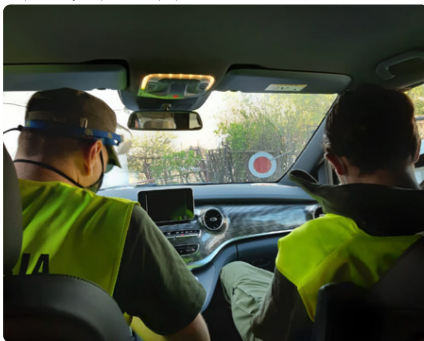
Inšpekcia verejného poriadku v aute počas dennej zmeny.