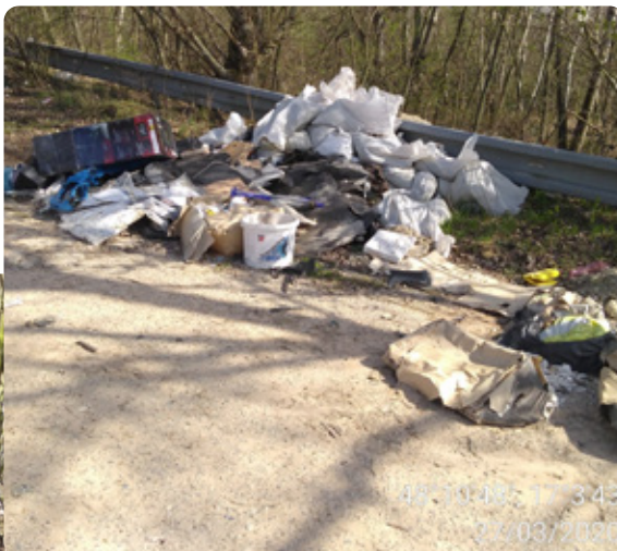
Nelegálne skládky sa chystáme zlikvidovať.