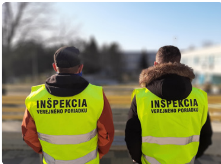
Členovia IVP sú vždy rozpoznateľne označení.

Inšpekcia verejného poriadku (IVP) je zložkou mestskej časti, ktorá doposiaľ vykonávala kontrolnú činnosť len v rámci plánovaných a nariadených akcií. Od marca tohto roku však zabezpečuje nepretržitú hliadkovú činnosť na celom území Lamača. Obyvatelia už dlhšiu dobu registrujú pohyb bielych vozidiel s označením IVP vo všetkých lokalitách. Hlavnou úlohou týchto motorizovaných hliadok je monitoring územia a prijímanie opatrení v prípade porušovania zákona, nariadení alebo zistenia rizikových situácií. „Ich počet je rôzny - podľa potreby alebo pláno-