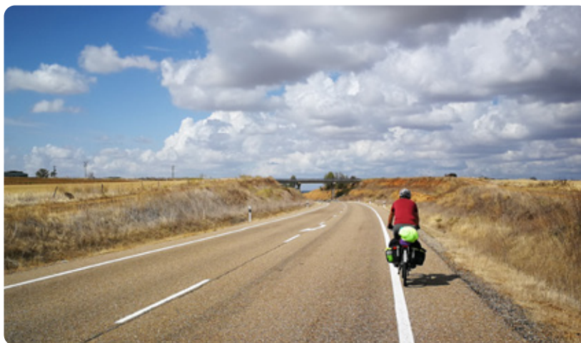
Na ceste si dvojica užívala krásne výhľady.

bagetu, ale aj rybacie alebo mäsové konzervy a šaláty, ktoré majú Francúzi veľmi dobré.