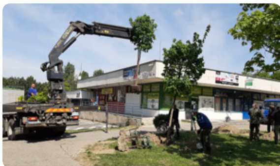
Pracovníci komunálnych služieb pri výsadbe javorov.

M alokarpatské námestie sa plní zeleňou. Začali to niektorí poslanci so starostom na Deň Zeme 22. apríla. Pracovníci komunálnych služieb pokračovali o pár dní na to výsadbou štyroch krásnych javorov a prvý máj strávili sadením vavrínovcov a kvietkov starosta, prednostka, niektorí poslanci, zamestnanci miestneho úradu a dobrovoľníci z komisie životného prostredia. To však ešte nie je všetko, zeleň sa bude dopĺňať aj naďalej.