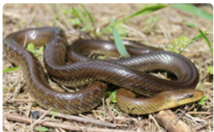
Vzácná užovka stromová

V iete o tom, že aj v Lamači sa vyskytuje vzácna užovka stromová? Minulý rok ju spozorovali Pod Zečákom, na Kačíne, na Červenej ceste, na Plánkach a v oblasti Krematória.