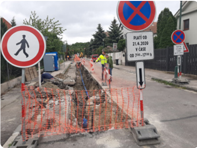
Zo Zlatohorskej bude ulica spájajúca moderné parametre a požiadavky.