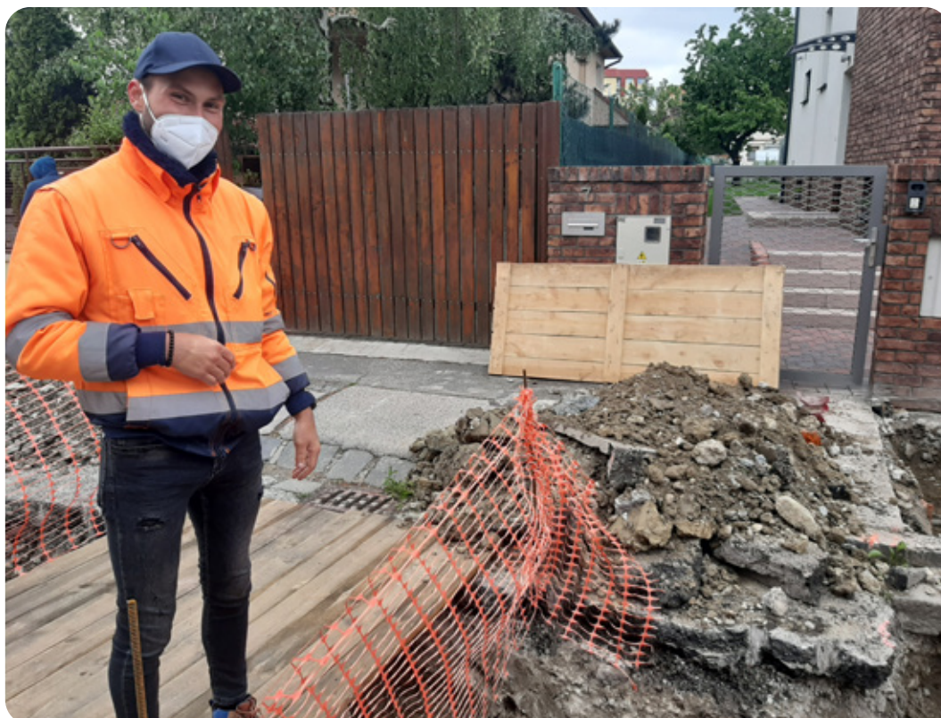
Na Zlatohorskej ulici sa kope a opravuje už niekoľko týždňov.

„Každý si asi vie predstaviť, že samostatná oprava plynovodu, vodovodu či výkopové práce na ulici stoja isté penia-