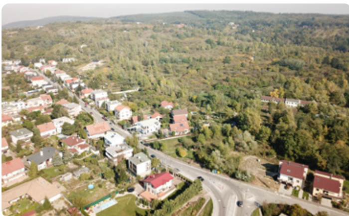
Lamačania sa čokoľ čo dostanú na bicykloch do mesta pohodlnejšie a bezpečnejšie.