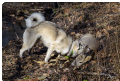
Pred niekoľkými mesiacmi pes pustený na voľno roztrhal srnku priamo pred zrakmi ľudí cestou na Kačín.

Nájazdmi nezodpovedných výletníkov trpia aj zvieratá, ktoré sú vytláčané zo svojho prirodzeného prostredia do okrajových častí a mnohokrát končia vo