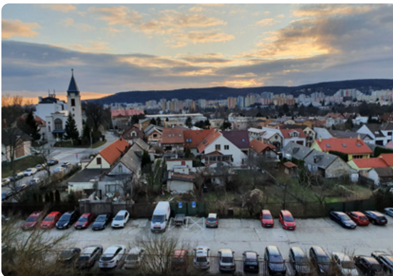
Čím viac Lamačanov sa prihlási v sčítaní obyvateľov tým viac financií bude obec mať.

Novinkou je, že sčítanie ľudí bude tentokrát prebiehať elektronicky, bez prítomnosti sčítacích komisárov s hárokami papierov, ktoré obyvatelia vyplňali. Ak nemáte prístup k internetu, zriadi