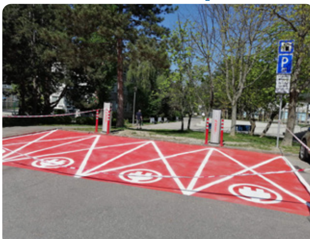
Nabíjacie stanice na elektromobily nájdete zo zadnej strany Domu služieb.

Čoskoro sa spustia nabíjacie stanice na elektromobily, ktoré nájdete na Malokarpatskom námestí na parkovisku pri pošte, zo zadnej strany Domu služieb. Tieto nabíjacie stanice sú súčasťou medzinárodného projektu, do ktorého sa spoločne zapojili hlavné mesto Bratislava, ZSE a kuriérska spoločnosť GO4, s.r.o. Ide o projekt URBAN-E, ktorý je zameraný na podporu rozširovania infraštruktúry elektronabíjajúcich staníc v Európe, mal by byť dokončený v decembri tohto roku. Prispeje k rozvoju elektromobility vo veľkých európs-