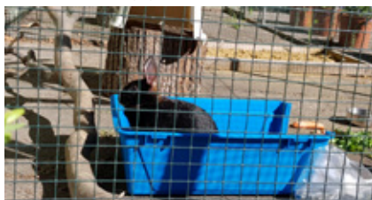
Tohto zajačika niekto bezcitne nechal pred veterinárnou ordináciou.

pár rokmi denný záchytný stacionár pre opustené zvieratá. „Ľudia sa možno ocitli v sociálnej núdzi, zaznamenal som, že mnohé zvieratá skončili vonku. Aj mne pred dvere ktosi položil zajačika v prenoske. Ráno som prišiel do práce a už ma tu čakal. Dali sme mu najesť, napíť, natrhali sme mu púpavu a zverejnili sme jeho fotku na sociálnych sieťach.“