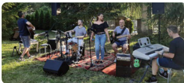
Kapelu Tuzzex Lamačania dobre poznajú. Nesklamala ani tentokrát zmesou československých hitov.