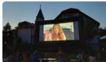
Francúzska komédia Čo sme komu urobili je vždy stávkou na istotu.

Letné kino aj tento rok Lamačanom spríjemnilo letné noci. Na Malokarpatskom námestí sa rozložili stoličky a okolo deviatej hodiny večer sa tam začali schádzať prví milovníci filmov. Raz sa premietalo vo farskej záhrade v rámci Malých hodov. Mali ste možnosť vidieť české komédie Vlastníci, Posledná aristokratka, Teroristka či francúzsku komédiu Čo sme