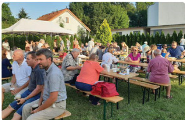
Farská záhrada sa zaplnila Lamačanmi, ktorí podujatie s radosťou prijali.