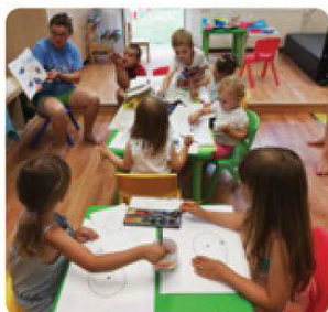
Prečítané leto sa tento rok v Rodinnom centre Obláčik uskutočnilo trikrát.

Rodinné centrum Obláčik nedalo ani tento rok šancu prázdninovému útlmu a opäť sa zapojilo do projektu Prečítané leto. Verejné čítanie pre deti prebiehalo v záhrade, ako aj v herni. Členky a dobrovoľníčky centra si pre deti, ktoré hrdinsky odolali lákaniu kúpaliska a dali prednosť intelektuálnej zábave poctivo pripravili knihy a interaktívne činnosti na rôzne témy.