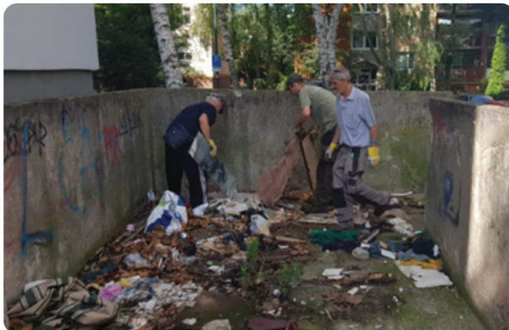
Pracovníci komunálnych služieb pri likvidácii čiernej skládky v stojisku medzi panelákmi na Studenohorskej ulici.

V katastrálnom území Lamača sa nachádza vyše 50 skládok, ak nepočítame skládky v stojiskách na Studenohorskej ulici. Tie totiž nedávno odpratala mestská časť. Väčšina skládok sa nachádza v okrajových oblastiach, napríklad v okolí Rázsoch, Zidín alebo záhradkárskej osady za Furmanskou ulicou. Niektorí spoluobčania sa ale neštítia ničoho, skládky sú aj hneď za plotom cintorína, jedna priamo za domom smútku. Väčšinou ide o komunálny a plastový odpad.