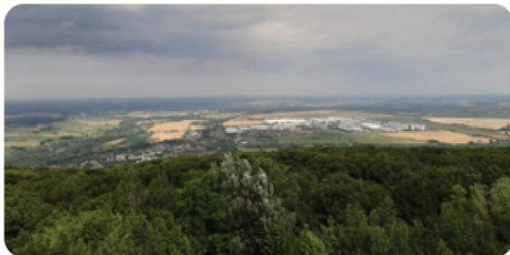
Vyhlíadková veža je vysoká 21 metrov a je z nej vidieť takmer celý Lamač.