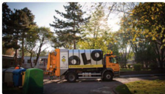
Nakladanie s odpadmi by sa malo v Lamači čoskoro zlepšiť.