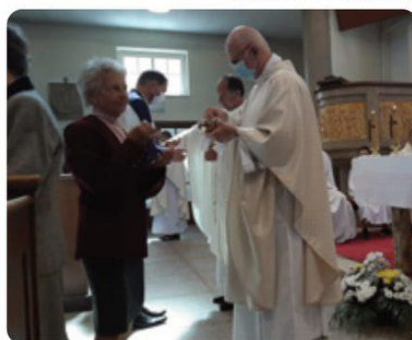
Slávnostnú svätú omšu v Kostole sv. Margity celeburovali štyria kňazi.