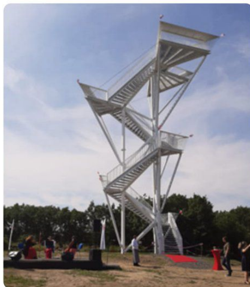
Devínska Kobyla má novú dominantu, na ktorú sa isto radi prídu pozrieť aj Lamačania.

Vežu tvorí sedem vyhlíadok, tie najkrajšie majú ponúkať najvyššie poschodia. Tri vyhlíadkové plošiny sú