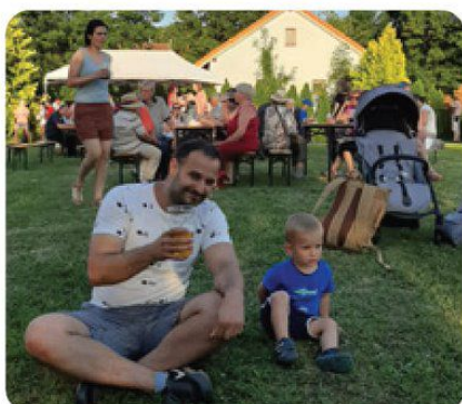
Malé hody prilákali aj množstvo rodín s deťmi.