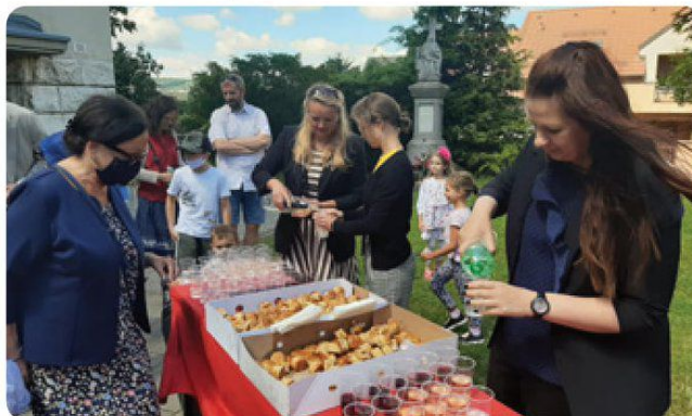
K dychovke dobre padlo občerstvenie v podobe pagáčikov a vína.