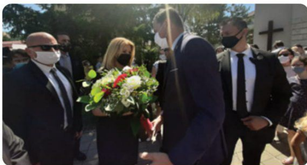
Starosta Lukáš Baňacký si uctil prezidentku Zuzanu Čaputovú veľkou kyticou.