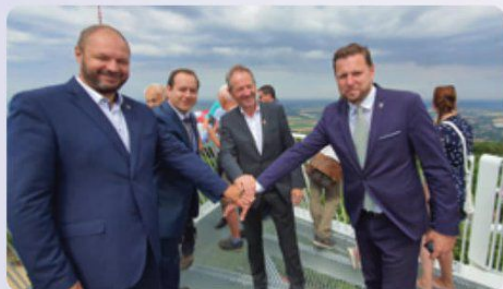
Vyhlíadková veža spája susedov. Starostovia okolitých mestských častí po slávnostnom otvorení.