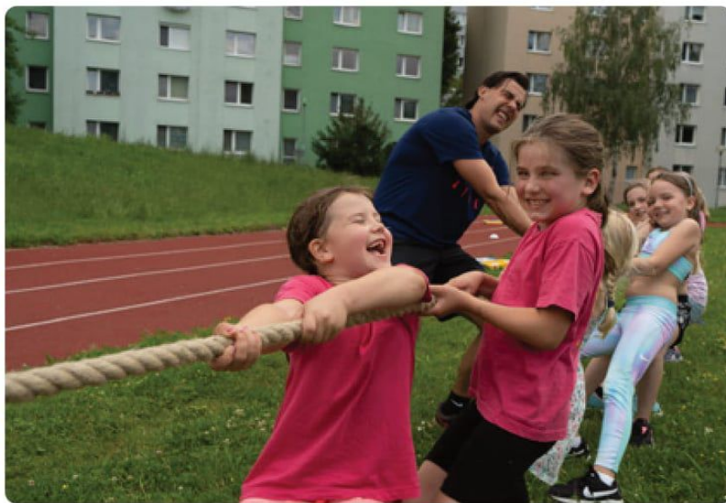
Na bežeckej dráhe býva deťom vždy veselo.

Začínali sme ako školský krúžok s osemnástimi deťmi, tento rok už