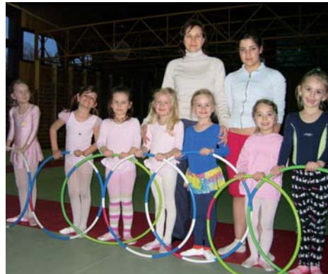
Prípravka dievčat od 4. rokov

Na Slovensku nie je tak veľa detí, ktoré sa venujú modernej gymnastike ako na Ukrajine, a preto ja vidím v každom dieťati talent. Ale talent možno vychovať len pri snahe dieťaťa a veľkej podpore rodičov.