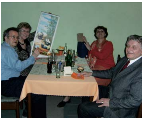
...vyhrali sme v tombole - pozrite!