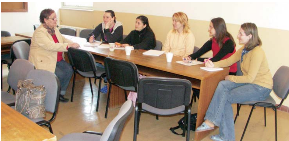
Účastníčky kurzu na jednej z prednášok

Záujem mamičiek je veľký, nakoľko získajú v rámci projektu všeobecne uznávané osved- čenie ECDL štart, absolvujú 7 rôznych tém