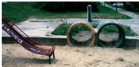
Ihrisko na Heyrovského ulici pred úpravami

Miestne zastupiteľstvo na svojom zasadnutí 28. 6. 2007 odsúhlasilo Návrh koncepcie ob-