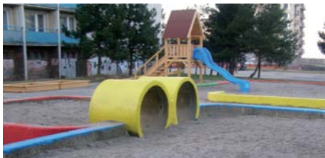
Ihrisko na Heyrovského ulici po úpravách

Svoje ďalšie otázky na poslancov alebo svoje názory môžete posilať na mailovú adresu lepiesova@lamac.sk .