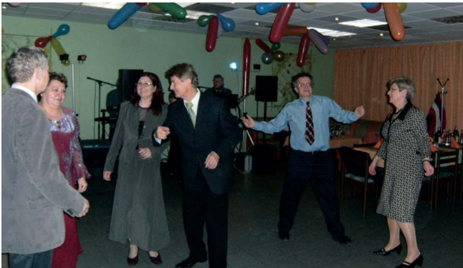
Toto sólo patrí nám...

Nebudeme zoširoka opisovať jej priebeh, tí čo prišli, sa určite dobre zabavili... A pre ostatných prikladáme zopár fotiek z akcie, aby videli, o čo prišli. Tešíme sa na vašu účasť na ďalších lamačských podujatiach! bv