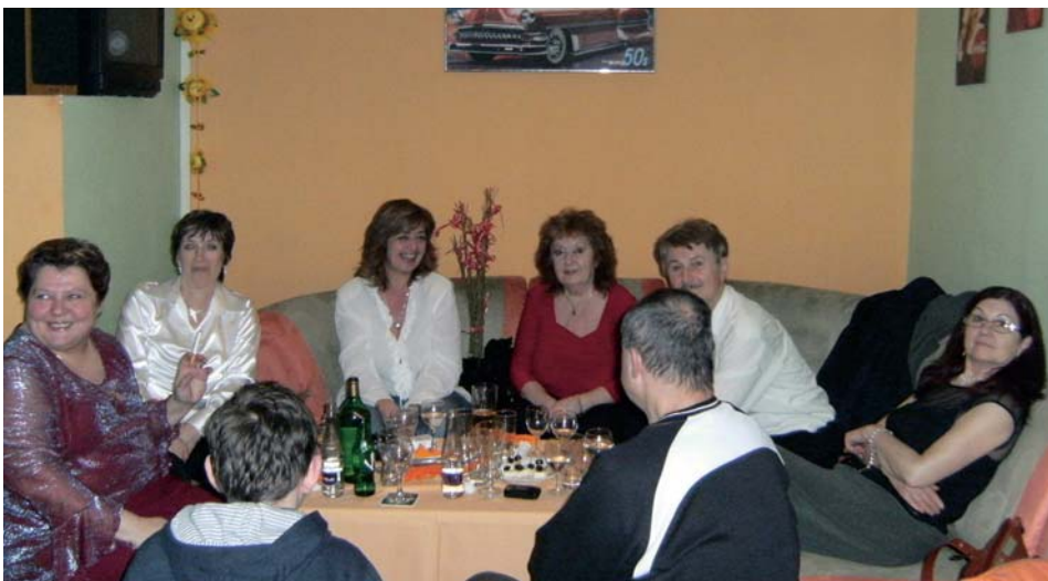
...dobrých ľudí sa všade veľa zmesť...