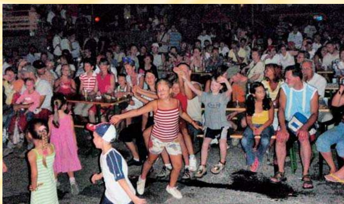
Na koncerte Metalindy sa bavili starí i mladá