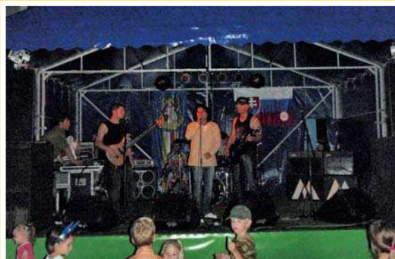
A na záver sobotného večera zahrála Metalinda