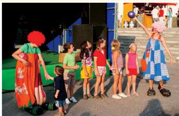
Duo Manti Nelly prilákalo veľa detí