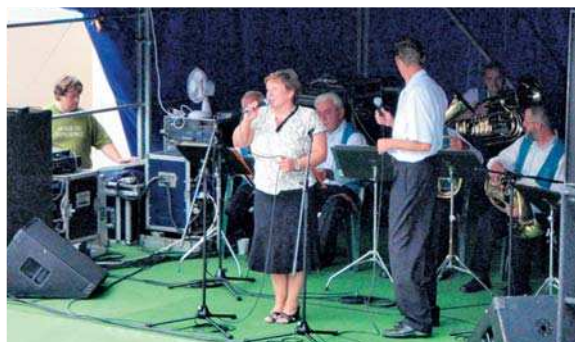
V nedeľu vystúpila aj Záhorienka