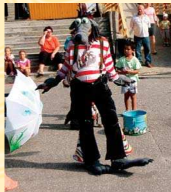
Prišli vlk i zajac...