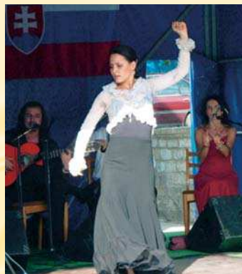
Remedios predviedlo svoje flamenco