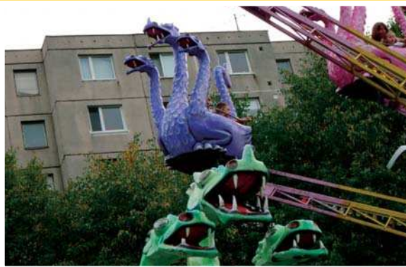
Kolotoče povozili malých i veľkých