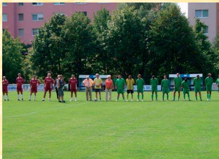
Futbalový zápas starých pánov Lamača