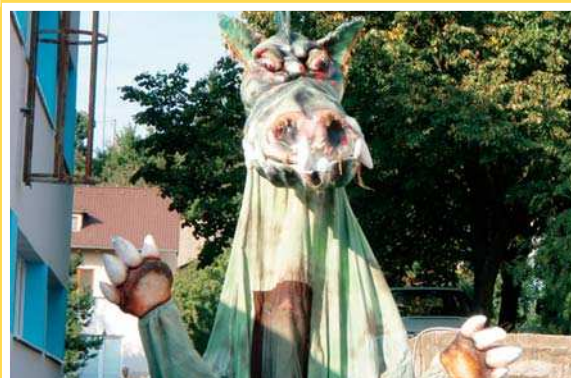
Divadlo Maska potešilo všetky deti