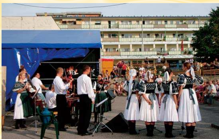
Vyvrcholením hrubých hodov bolo vystúpenie Sľuku