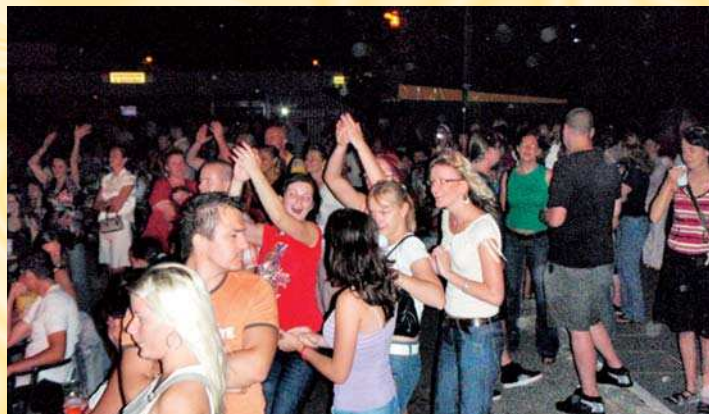
Dobrá zábava bola až do polnoci...