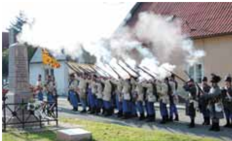
Obete bitky pri Lamači si pripomenuli aj slávnostnou salvou pri pomníku na Vrančovičovej ulici