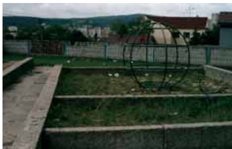
Ihriská po úprave