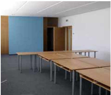
Rokovacia miestnosť pre MZ