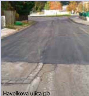
Havelkova ulica po