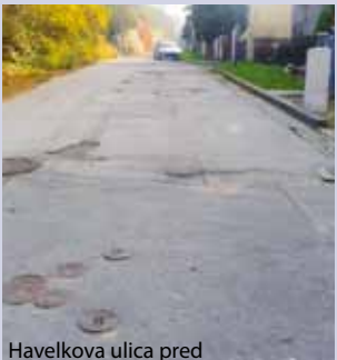
Havelkova ulica pred