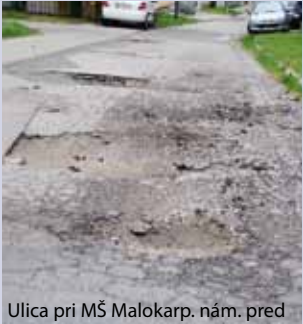
Ulica pri MŠ Malokarp. nám. pred