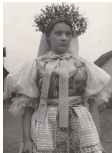
Nevesta v lamačskom kroji