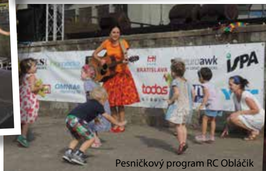
Pesničkový program RC Obláčik