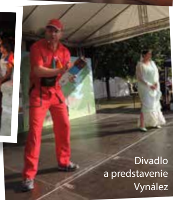
Divadlo a predstavenie Vynález