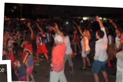
Kubánske tance si vyskúšali aj Lamačania