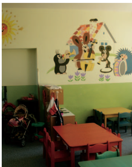
Cirkevná materská škola Gianni Berettovej Molloyovej