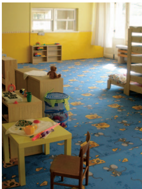
Súkromná škôlka Zvonček

Ďalším novovzniknutým subjektom v Lamači je aj alokované pracovisko Cirkevnej materskej školy Gianni Berettovej Molloyovej - Bilíková ulica so sídlom na Zlatohorskej ulici, kam sa vlastne bývalé triedy s cirkevným zameraním MŠ opäť vrátili, avšak do rozšírených priestorov – 2 pavilónov. Škôlka naplnila celú svoju kapacitu – 41 detí a okrem novoprijatých detí do nej prestúpili aj deti z Oázy – Malokarpatského námestia.