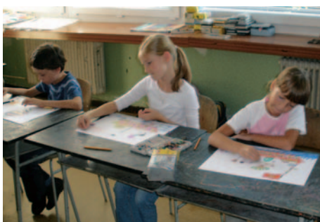
Dievčatá vytvárajú svoje diela.