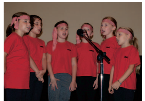
Tretiaci zaspievali pesničku.