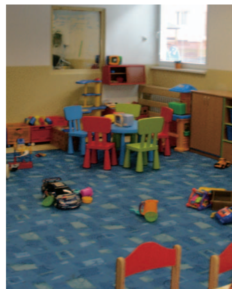
Materská škola na Heyrovského ulici