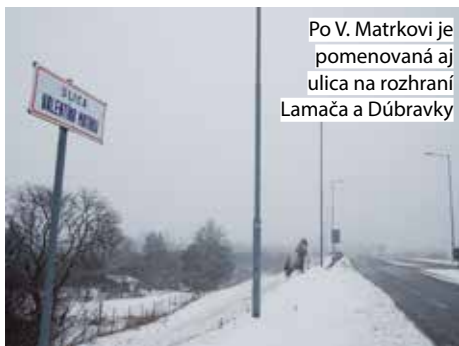
Po V. Matrkovi je pomenovaná aj ulica na rozhraní Lamača a Dúbravky