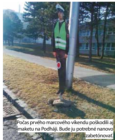
Počas prvého marcového víkendu poškodili aj maketu na Podháj. Bude ju potrebné nanovo zabetónovať.

Ešte v minulom roku umiestnila mestská časť na dvoch miestach v Lamači makety policajtov, konkrétne v zóne 30 na ulici Pod Zečákom, a tiež na ulici Podháj v blízkosti priechodu pre chodcov. Makety policajtov sú prevereným a účinným prostriedkom proti rýchlej a bezohľadnej jazde, ktorou nezodpovední vodiči v zastavaných štvrtiach ohrozujú zdravie a životy chodcov. A keďže oba úseky, na ktorých boli makety osadené, sú známe tým, že sa tam mnohí vodiči ani len neobťažujú dodržiavať povolenú rýchlosť, veríme, že „policajti celkom ako skutoční“ budú vytvárať účinný psychologický efekt a donútiť šoférov dať nohu z plynu. Aby ale tak bolo, nesmie sa stať, že maketu niekto ukradne. Na ul. Pod Zečákom sa tak stalo dokonca dvakrát!!!...Vandalstvo je pre niekoho možno frajerina. Ak sa ale týka niečoho, čo má pomáhať, je nielen neprístojná, ale aj nebezpečná. Aj preto, chráňme si to, čo má chrániť nás!!!!