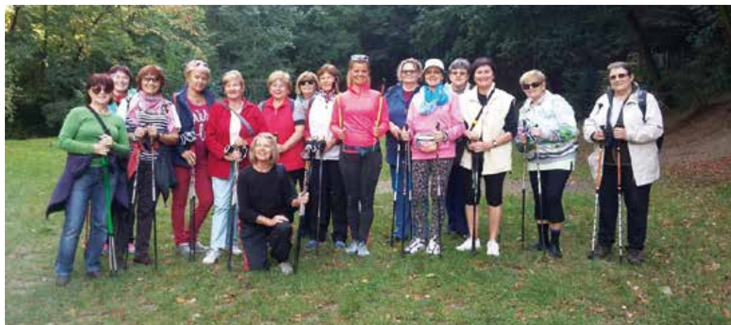
K nordic walking patrí dobrá partia