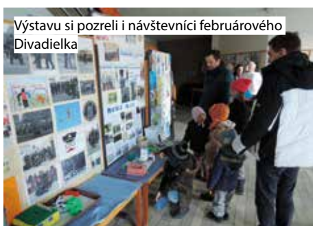
Výstavu si pozreli i návštevníci februárového Divadielka

Ktoré deti kreslili a tvorili? Sú to deti zo ZŠ Lamač, z MŠ na Heyrovského ulici, z MŠ na Malokarpatskom