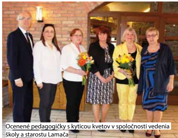
Ocenené pedagogičky s kyticou kvetov v spoločnosti vedenia školy a starostu Lamača