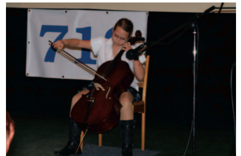
Vystúpenie detí zo ZUŠ J. Kresánka.