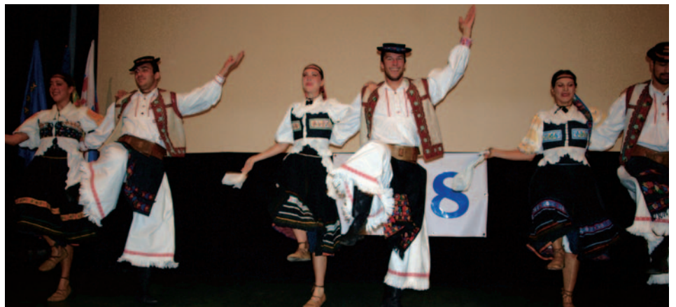
Vystúpil aj folklórny súbor Lipa.